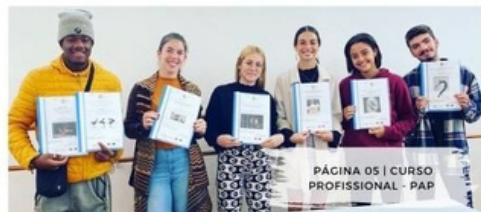
PÁGINA 05 | CURSO PROFISSIONAL - PAP