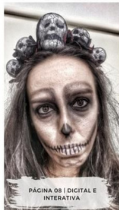
PÁGINA 08 | DIGITAL E INTERATIVA