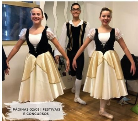
PÁGINAS 02/03 | FESTIVAIS E CONCURSOS