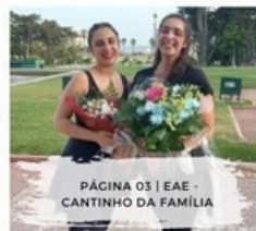
PÁGINA 03 | EAE - CANTINHO DA FAMÍLIA