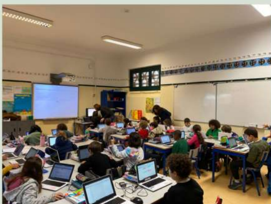
Professoras titulares do 2.º ano