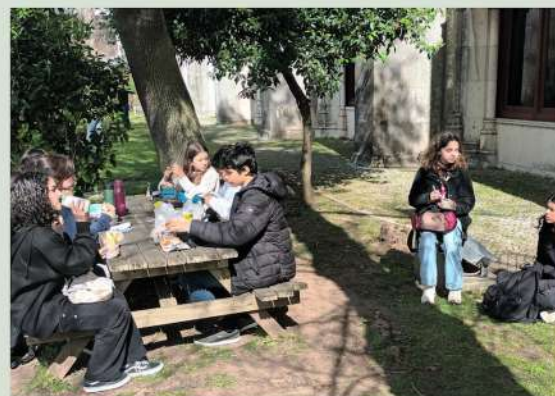
A turma do 7.ºC