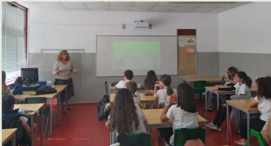
Turma 6.º G

Todos temos de ter muito cuidado, de estar muito atentos com a internet e utilizá-la bem e de forma moderada, porque há muitos perigos e pessoas mal intencionadas.