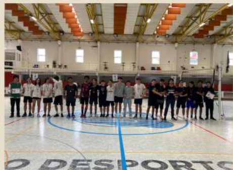
Torneio Masculino/Misto (11.ºAno)

Alcançaram lugares de pódio as seguintes equipas, representativas de turma: