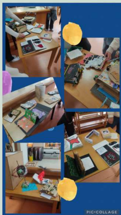
Alunos do 12.º F