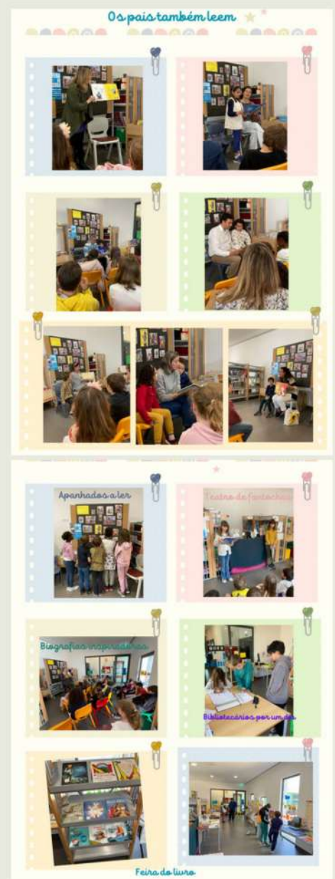
As professoras Bibliotecárias

No âmbito da Semana da Leitura, os pais dos alunos do 1.º ciclo da Escola Básica de Santo António foram convidados a participar na atividade “Os pais também leem”. Ao longo da semana, todas as turmas receberam alguns dos pais dos alunos que nos proporcionaram momentos únicos de leitura partilhada, apresentando histórias tão fascinantes quanto divertidas. Durante as sessões foram abordados vários temas como a amizade, a autoconfiança, a tolerância, o valor da diferença ou o poder criativo das histórias. Esta atividade teve como objetivo despertar (ainda mais) o gosto pela leitura e integrar a família no processo de valorização da mesma.