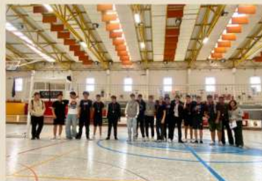
Torneio Masculino/Misto (9.ºAno)

1.º Lugar - 9.º C 2.º Lugar - 9.º A 3.º Lugar - 9.º E