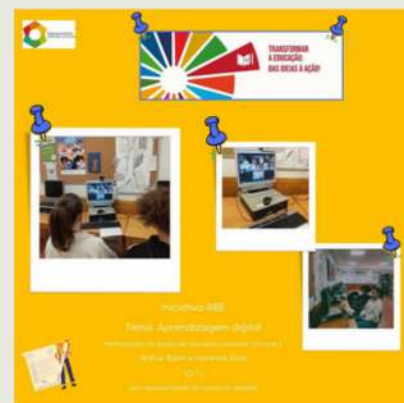
Alunos do 10.ºJ

O projeto já está a ser implementado, daremos notícias sobre as próximas etapas!”