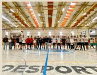
Torneio Masculino/Misto (10.ºAno)

Alcançaram lugares de pódio as seguintes equipas representativas de turma: