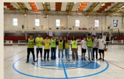
Equipa de arbitragem