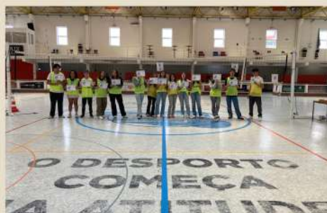
Equipa de arbitragem (11.º/12.º)