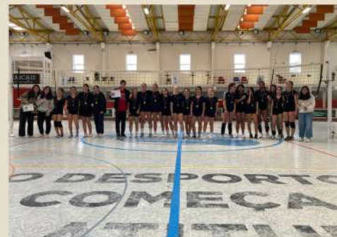
Torneio Feminino (11.ºAno)

1.º Lugar - 12.º A 2.º Lugar - 12.º B 3.º Lugar - 12.º C