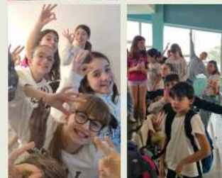
Alunos do 5.º D