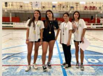
Torneio Feminino (10.ºAno)

1.º Lugar - 10.º C 2.º Lugar - 10.º D 3.º Lugar - 10.º B