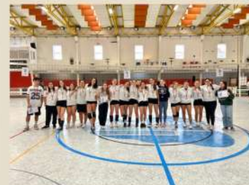
Torneio Feminino (9.ºAno)

1.º Lugar - 9.º C 2.º Lugar - 9.º A 3.º Lugar - 9.º E