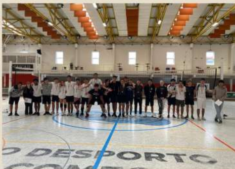
Torneio Masculino/Misto (12.ºAno)

1.º Lugar - 11.º E 2.º Lugar - 11.º C 3.º Lugar - 11.º B