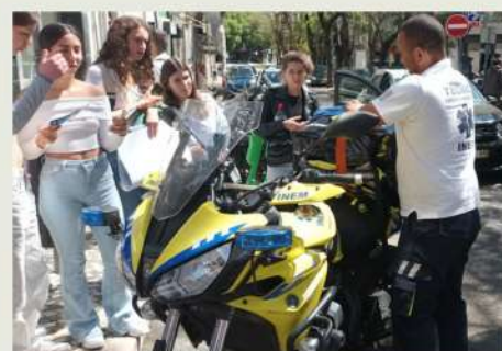
Alunos do 10.ºL