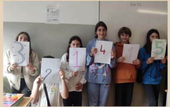
Professores de Matemática do 6.º ano