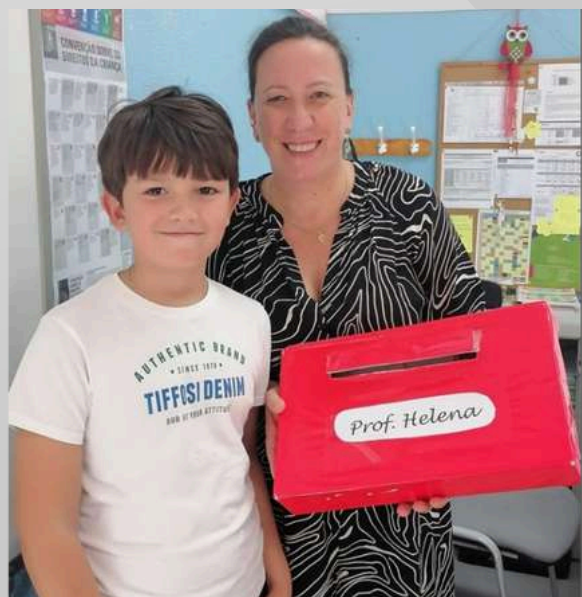
Assistentes Operacionais da EB/JI do Murtal