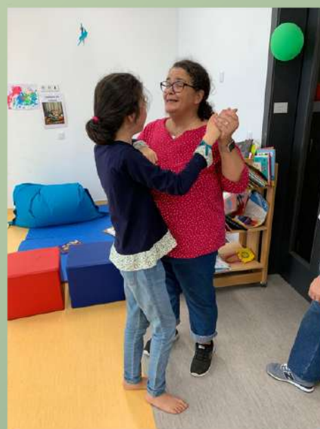
aluna e professora Valência Apoio Especializado-outubro 2024