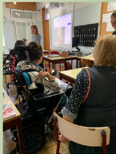
aluno com paralisia cerebral - outubro 2024