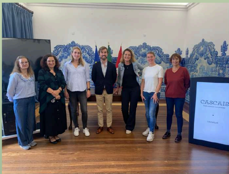
recepção Câmara Municipal de Cascais-outubro 2024