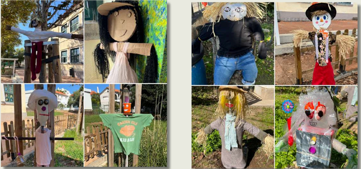
Os alunos do 2.º B da EB Afonso do Paço

Na nossa turma, fizemos espantalhos com materiais reciclados e tivemos ajuda das nossas famílias. As nossas construções foram realizadas com diferentes materiais e desperdícios: garrafas de plástico, latas, roupa velha e até tampas de frascos. Foi uma atividade muito gira porque ajudámos o ambiente e demos nova vida ao "lixo" de casa. Os espantalhos ficaram expostos no recreio e todos os colegas e professores adoraram! Aprendemos que é importante reciclar e que, juntos, podemos criar coisas incríveis. Foi uma forma especial de passar tempo com a família e de cuidar do planeta.