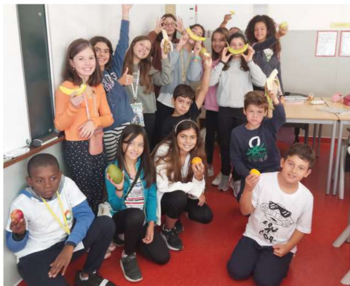
5.ºG - Banana