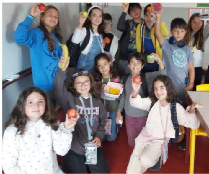
5.ºH - Salada de Fruta